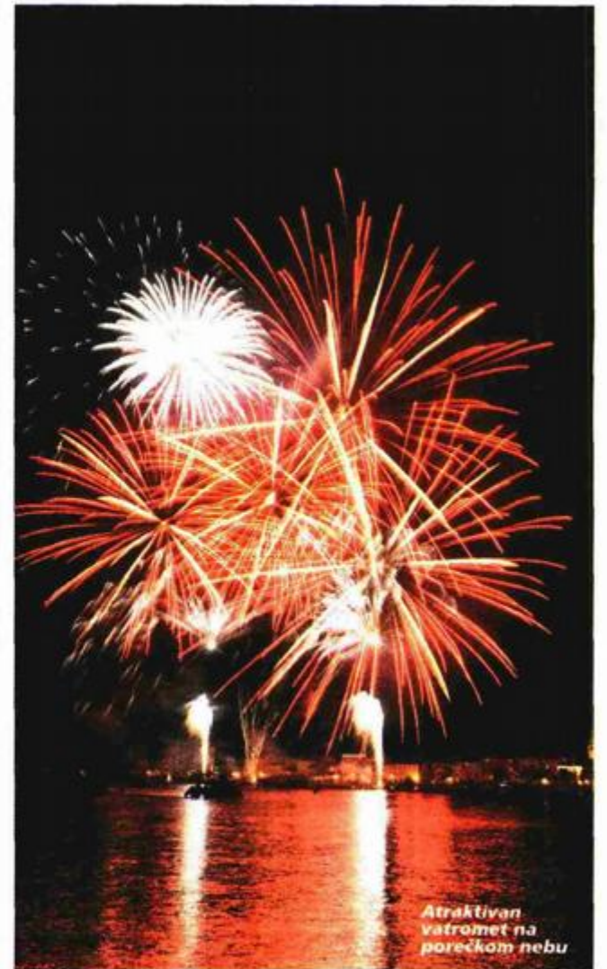
Atraktivan vatromet na porečkom nebu