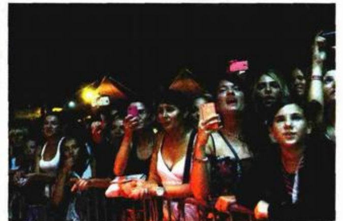
Ženska publika natiskana u prvim redovima

Riva je tijekom fešte vrvjela domaćim i stranim posjetiteljima kojih je