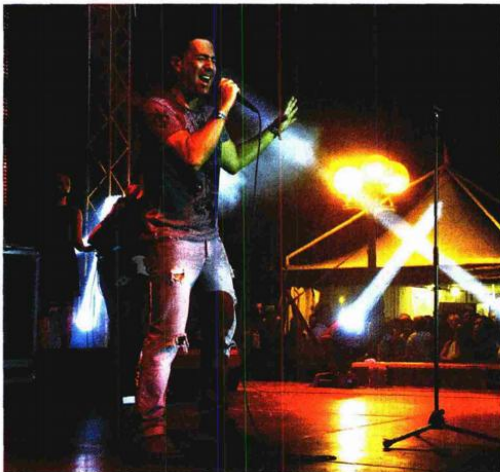
Sa Željkom Joksimovićem pjevali su i plesali obožavatelji svih generacija

Mnogobrojni su obožavatelji svih generacija s izuzetno popularnim srpskim pjevačem natiskani na porečkoj rivi pjevali i plesali. Uz posljednje su se dvije pjesme, od kojih je zadnja bila Joksimovićev najveći hit - "Lane moje", predstavljena na Eurosongu 2004., veselili i tražili još pod snažnom kišom zbog koje su tehničari ubrzano radili na zaštiti tehničke opreme. No, priroda, koja je munjama najavila svoje intencije već uoči vatrometa nadmećući se s njime u atraktivnosti, zvijezdi večeri, unatoč njegovoj dobroj volji, nije dozvolila bis. I najupornija se publika, koja je do kože pokisla skandiraju-