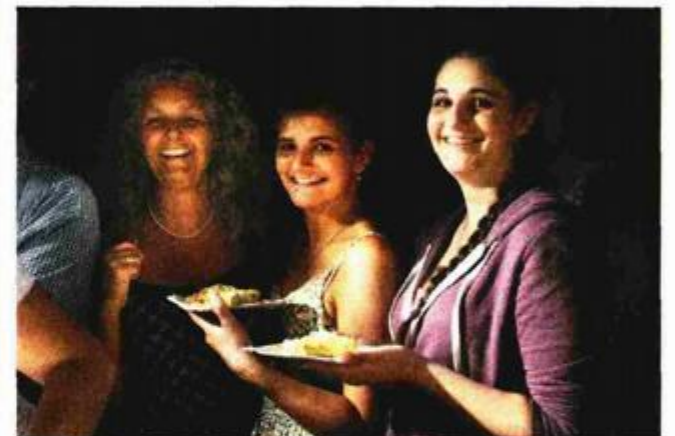
Rijetko tko je propustio degustaciju najveće krempite u Hrvatskoj

ipak bilo manje nego ranijih godina, vjerojatno i zbog činjenice da su se istovremeno odvijale fešte u Novigradu, Funtani, Rovinju i Puli. U prvom su se večeri uz Dogmu i TBF odlično proveli u prvom redu mladi, dok je druga privukla šaroliku publiku. Neki su se jednostavno došli proveseliti i guštati u vatrometu, većini je zanimljiva i simpatična bila priprema divovske krempite.